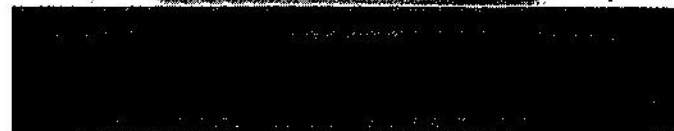
Lo striscione del progetto Sea Breeze